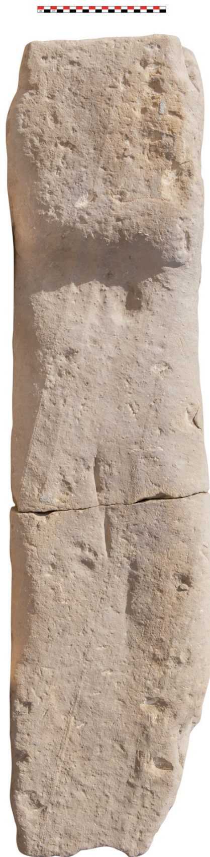
Fig. 4. Face arrière © CNRS-CFEETK/Q. Dufour (négatif n° 156845).