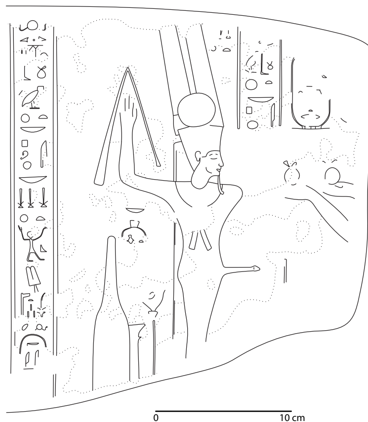
Tableau extérieur droit

[Le roi de Haute et Basse Égypte], Min-Amon-Rê, le taureau de sa mère, qui est sur son grand siège, le faucon au bras levé, le mâle des dieux. Le roi de Haute et Basse Égypte (Autocrator).