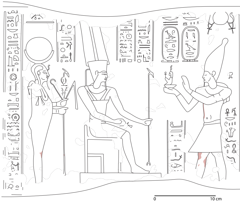
Tableau central droit

Le roi de Haute et Basse Égypte, Amon-Rê, le roi des dieux, le grand dieu, le seigneur du ciel, de la terre, de la douat, de l'eau et des deux montagnes, le souffle de vie pour [...] 7 .