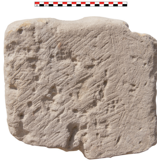
Fig. 6. Face latérale droite (négatif n° 156844).