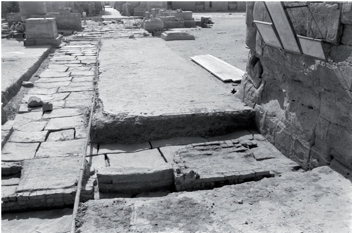
Fig. 7. Vue du linteau en place dans le passage du premier pylône en 1969 (négatif n° 1465).