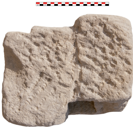
Fig. 5. Face latérale gauche (négatif n° 156843).