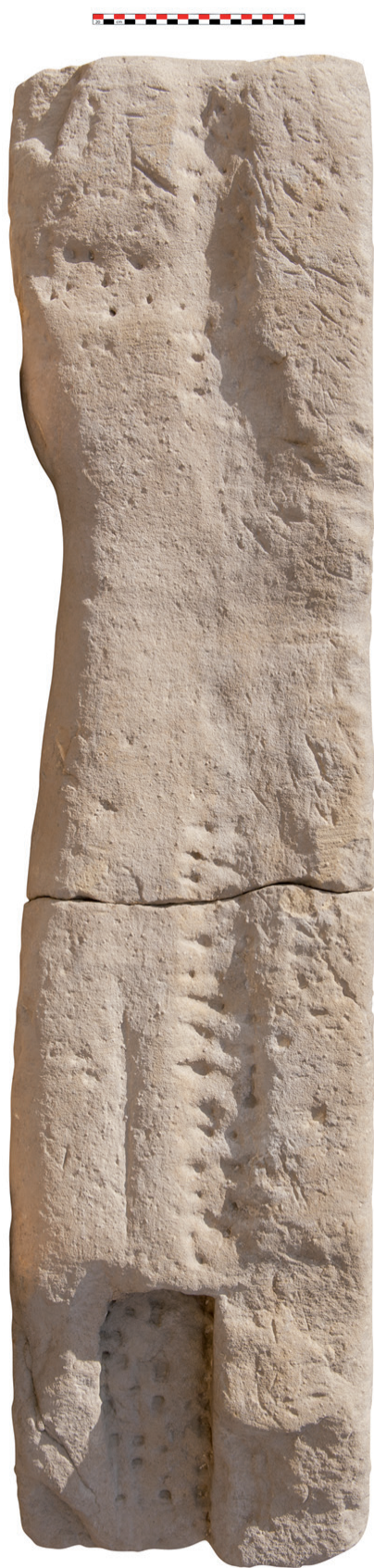
Fig. 3. Face supérieure (négatif n° 156846).