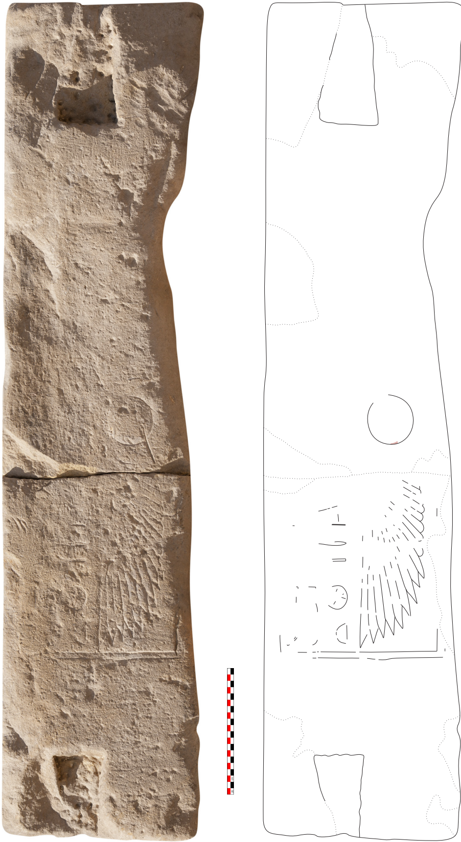
Fig. 2. Soffite © CNRS-CFEETK/Q. Dufour (négatif n° 156847), dessin A. Tillier.