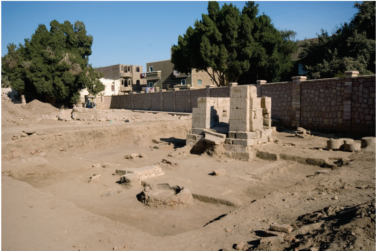
Fig. 3. Vue générale après la première campagne de fouilles.

Côté est, le mur extérieur laisse deviner le départ d'un mur en brique qui enserrait la porte du domaine de Thot.