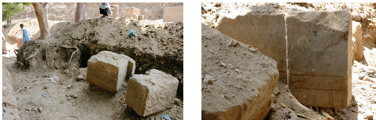
Fig. 1-2. Blocs découverts dans la tranchée du mur de clôture du site.

Il est important de rappeler que lors de la construction du mur moderne pour la protection du site de Karnak en 2006, une fouille de sauvetage a été menée autour de la porte, alors abandonnée et lieu de dépôt de débris du village voisin d'el-Hassasna. E. Laroze, alors directeur du Cfeetk, décida d'entreprendre une « campagne » de photographies et de localisation des blocs, reportés sur un plan qu'il nous a généreusement fourni. Des blocs fort intéressants ont ainsi été mis au jour, relevés et photographiés ( fig. 1-2 ). Sur les photographies, apparaissent également les assises d'une deuxième chapelle, probablement celle mentionnée par Lepsius sous la désignation de temple M. Au cours de ces travaux, S.-A. Ashton a également réalisé une couverture photographique qu'elle a transmise par la suite à Mansour Boraik, ce dont nous la remercions vivement.