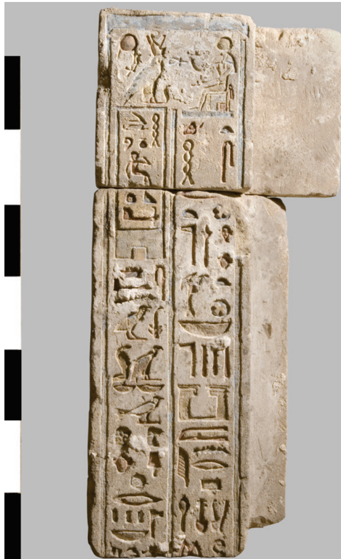
Fig. 3. Tableau du montant droit d'une porte de Ptolémée Philopator.

Au stade actuel des fouilles, il est encore trop tôt pour proposer un plan général de ce qu'était le complexe religieux dédié à Thot ( fig. 5 ). Il s'agira d'élargir la fouille vers l'ouest ce qui devrait permettre d'obtenir des indices archéologiques sur les temples M et F mentionnés par Lepsius et Prisse d'Avennes au milieu du XIX e siècle.