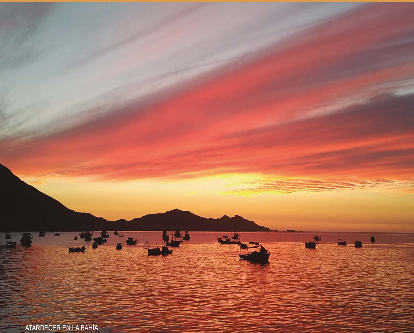
ATARDECER EN LA BAHÍA

Revista del Museo Augusto Capdeville Rojas de Taltal