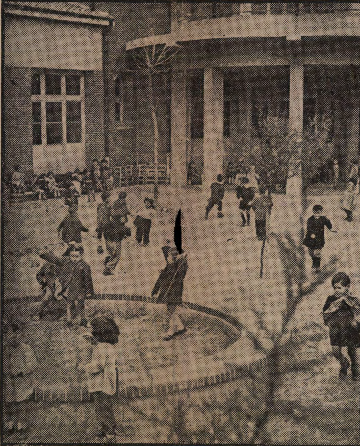
PROTEGEONS NOS ENFANTS !

NOUS VOULONS LA PAIX ! C'est pourquoi nous espérons, ami du peuple, qui permettra, comme le demande notre programme : L'EPANOUISSEMENT DE FAMILLES HEUREUSES DANS UNE FRANCE LIBRE ET PROSPERE ET DANS UN MONDE EN PAIX.